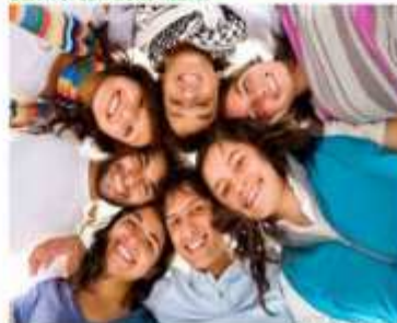
Am Fronleichnamswochende (3. Bis 6. Juni)